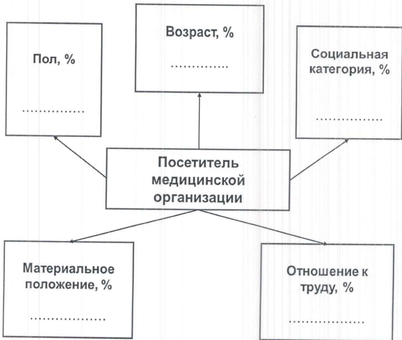
Рис. 2 Социально-демографический портрет респондента

Примечание: строится по максимальным значениям общего количества ответов (таблица 1, колонка 8).