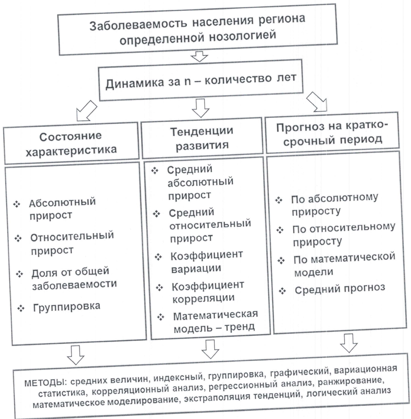
Рис. 1. Алгоритм исследования заболеваемости населения на региональном уровне