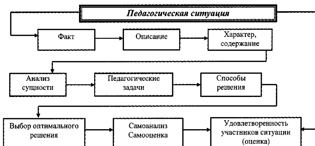
Рис. 1. Алгоритм решения педагогических ситуаций

Задание: провести педагогический анализ профессиональной ситуации, используя алгоритм пошаговой методики их решения (рис. 1)